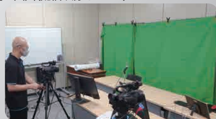
グリーンバックでクロマキー合成(背景切り抜き)