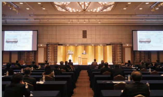
総会の模様をライブ中継(会場の様子)

「どこから進めたらよいのか分からない」方もまずはお問い合わせください。ご案内いたします。