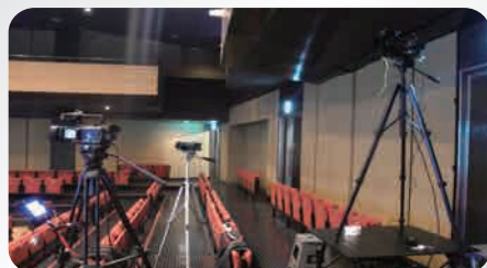
配信用カメラは3台。適宜、画面を切替